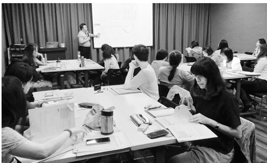
▲英語教師聯誼會辦理研習講座，介紹如何運用多益普及英語測驗於國中教育會考，吸引20多位現任教師參加。

第二個核心重點，在於更新後的題型可協助準備國中教育會考。他以聽力測驗的圖片描述題為例，原版的題型是單考點（指一個題目當中只需懂一個重點概念即可作答）、真實圖片。