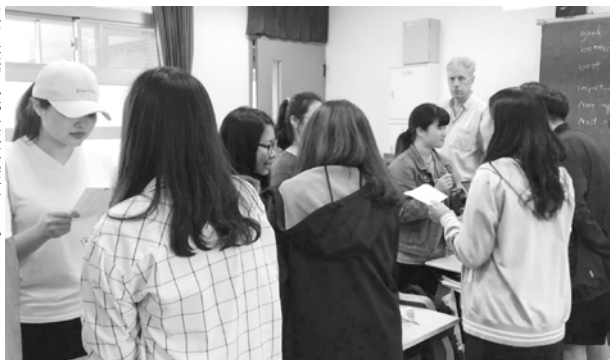
▲弘光科大暑期英語密集班，外師要學生兩人一組，練習職場情境的聽力與口說。